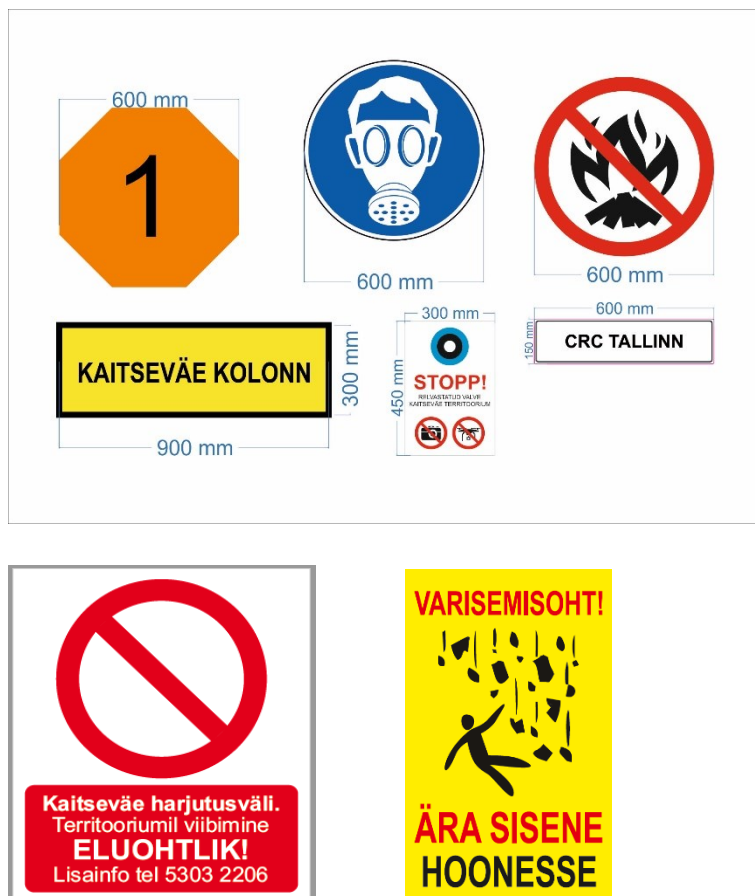
Pildid 3-5. Näidised: